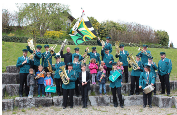
Text: und Bild: Ursi Rieser, Musikgesellschaft Uesslingen

Dann nimm doch mit uns Kontakt auf Ursi Rieser, Trüttlikon 4, 8524 Uesslingen- Buch / 052 746 13 43 Ursi.rieser@bluwin.ch www.mg-uesslingen.ch