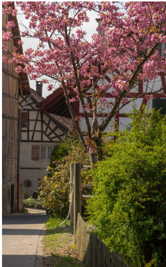
In Wilen.