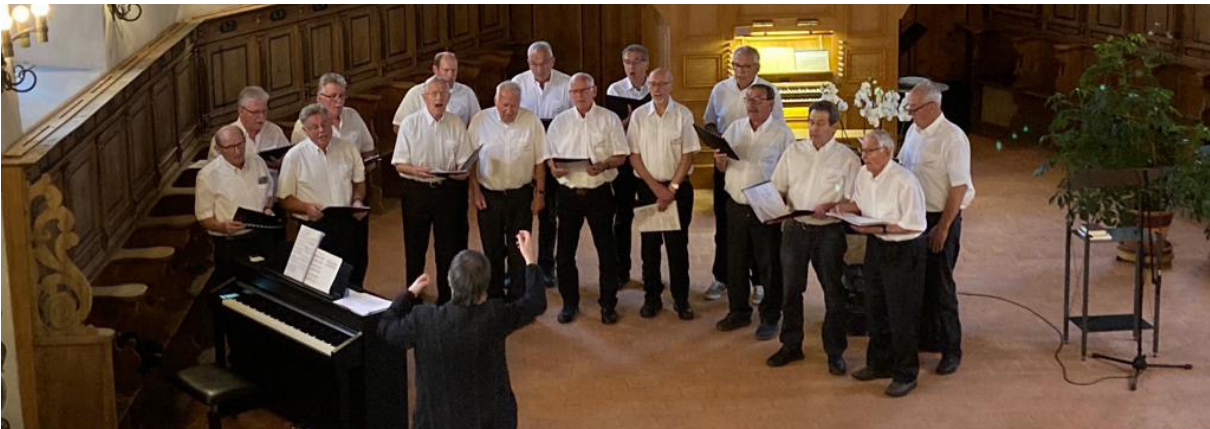
Der Männerchor Oberneunforn sang am Konzertgottesdienst an Auffahrt