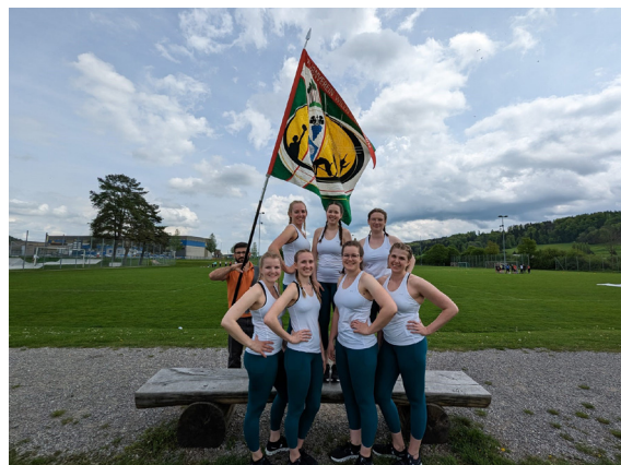
Text und Bild: Sabrina Grunder für TV Wilen-Neunforn