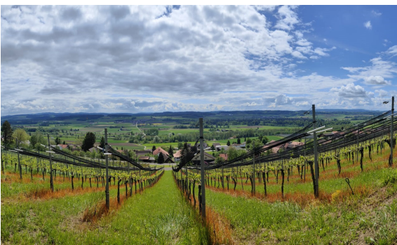
Text und Bild: Jenny Buser, Team Föhrenblick

Immer wieder erhält das Redaktionsteam des Föhrenblicks wunderschöne, lustige und spannende Bilder aus den persönlichen Bildarchiven der Leser:innen zugeschickt. Ob von der Profi-Kamera oder vom Handy: Wenn die Bilder scharf sind und wir den Platz dafür finden, drucken wir sie gerne ab, natürlich immer mit Urheberangabe. Haben auch Sie ein Foto geschossen, das Sie gerne zeigen möchten? Wir freuen uns über die Zusendung an foehrenblick@neunforn.ch , idealerweise mit einer kurzen Bildbeschreibung. Vielen Dank, dass Sie alle mit Ihren Bildern und Texten dazubetragen, dass der Föhrenblick so bunt und abwechslungsreich erscheinen kann!