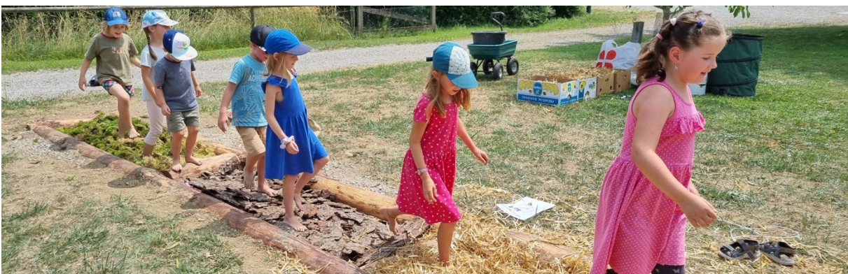
Befüllen und Ausprobieren des Barfusspfades