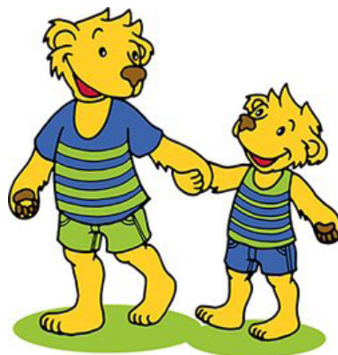
Text und Bild: Heinke Gass

Heinke Gass, Fährhaus 12b, 8525 Niederneunforn, 079 358 07 22 / 052 740 20 87 heinkegass@hotmail.com