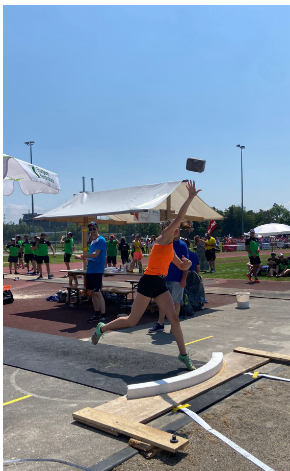
Bilder und Texte: Samara Müller Aktuarin TV Wilen-Neunforn