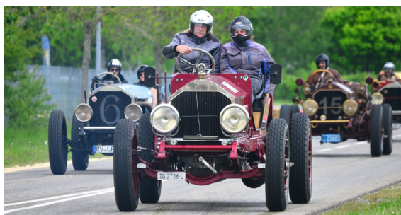
Bilder und Text: Katarina Pipa & Roland Britschgi

Begegnungen, ob Fussgänger oder Verkehrsteilnehmern, ein staunendes Lächeln ins Gesicht.