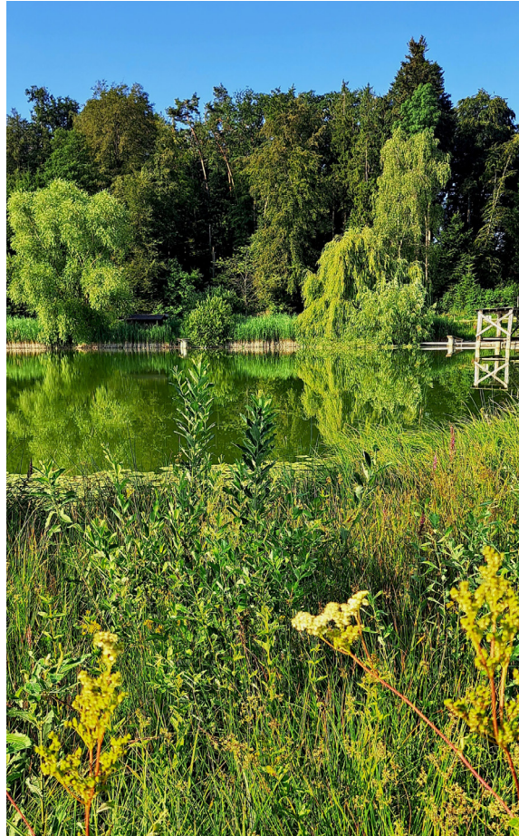
Wilemersee am 10.7.2023