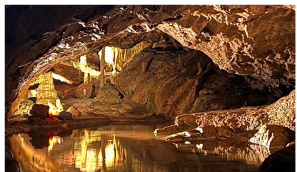
In der Beatushöhle

Aber auch der Besuch der Beatushöhlen war ein besonderes Erlebnis.