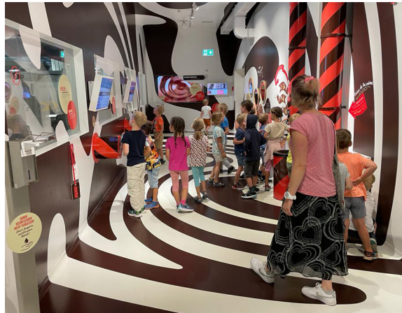
Im Chocolarium

Wir danken Gabi Eisenegger ganz herzlich für die 20 Jahre, die sie nun an unserer Schule mit Herzblut, Freude und riesigem Engagement arbeitet.