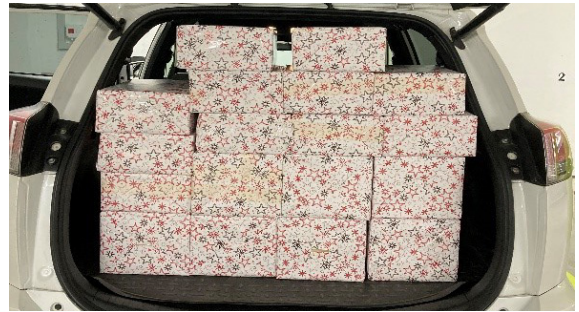
Text und Foto: Esther Gredig

Herzlichsten Dank auch an die Unterstützung des Volg-Teams, der Mühle Entenschies für das gespendete Mehl und Ihnen allen für Ihren wertvollen Zustupf.