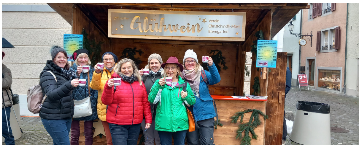
Text & Bilder: Susanne Burri, LFV Neunforn