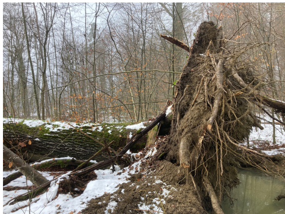
Leider steht die grosse Eiche nicht mehr.