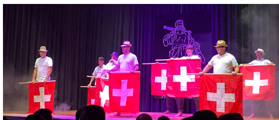
Text & Bilder: Sabrina Grunder, TV Wilen-Neunforn