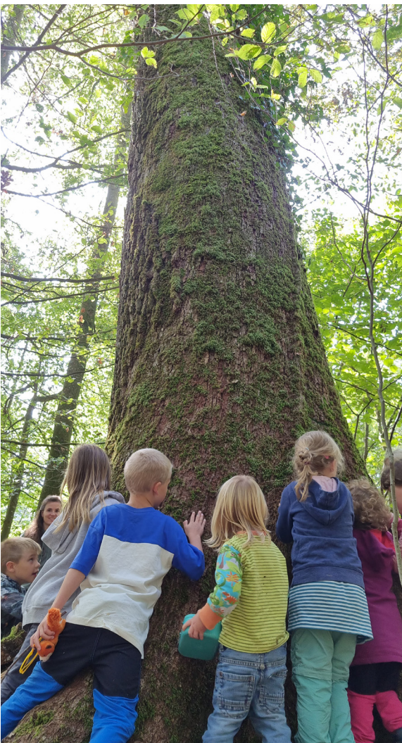
Die Eiche wurde oft bestaunt

Es ist traurig, dass gerade diese Eiche nicht mehr weiterwächst, denn die war ein Symbol für Stärke, Vitalität und Widerstandskraft im Nüüfemer Wald. Die Politische Gemeinde hatte sich schon vor Jahrzehnten entschieden, dass diese Eiche stehenbleibt und im Jahr 2021 wurde dies mit dem Forstamt Thurgau vertraglich für 50 Jahre festgelegt. Auch Bäume sterben, aber im Grüe stehen noch Eichen, welche annähernd so gross sind. Ich hoffe, dass diese noch Jahrzehnte stehen bleiben.