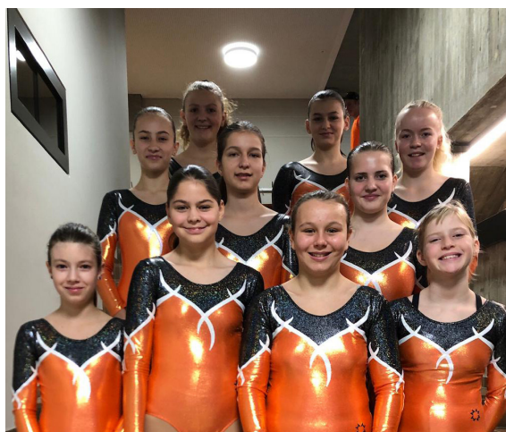
Text & Bild: Sabrina Grunder, TV Wilen-Neunforn

Am Turnfest, welches wir im letzten Sommer durchgeführt haben, wünschten einige unserer Sponsorinnen und Sponsoren, dass ihr Geld für unsere Jugendriegen eingesetzt wird. So durften wir bereits im Frühling zwei Trainigssamstage durchführen und jetzt an der Abendunterhaltung unsere neuste Anschaffung präsentieren: Stolz trugen die Kinder der grossen Mädchenriege ihre neuen Turngwändli für die Barrenvorführung. Auf dem Bild können Sie sehen, in welchem Tenü unsere jungen Turnerinnen in Zukunft ihre Geräteübungen zeigen werden. Wir danken den Sponsorinnen und Sponsoren nochmals herzlich für die Unterstützung unserer Jugendriegen.