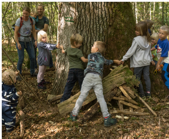
Am Waldtag Anfang Oktober