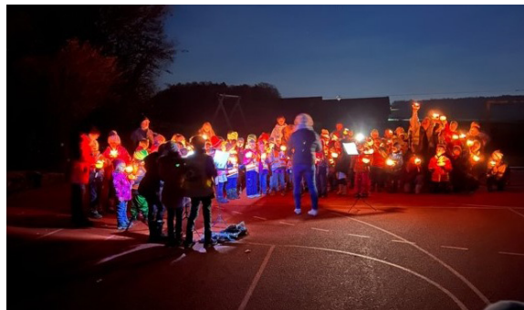
Lieder auf dem roten Platz

Wir danken allen Seniorinnen und Senioren für den Besuch am Seniorensingen und allen Eltern, die am Lichterfest mit dabei waren.