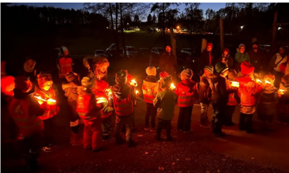
Der Umzug um das Schulhaus

Das Lichterfest und das Seniorensingen der Schule finden jedes Jahr in einer etwas anderen Art statt. In diesem Jahr fand das Lichterfest rund um das Schulhaus statt – mit einem ganz traditionellen Rübä-Liechtli-Umzug. Da der Anlass eher den kleineren Kindern entsprach, war er für die beiden Kindergärten und die beiden 1./2. Klassen obligatorisch und für die 3./4. Klasse freiwillig. Die 5./6. Klasse nahm am Anlass