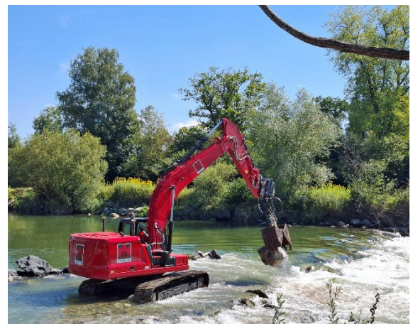
Entfernung Blocksteine zur Freilegung Spundwand, Foto von AFU TG

Durch diese Sanierung wird die Längsvernetzung für schwimmschwache Fische mit geringem Aufwand wiederhergestellt. Eine freie Fischwanderung ermöglicht den genetischen Austausch und trägt zur Erhaltung stabiler und widerstandsfähiger Fischpopulationen bei.