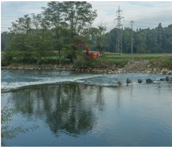
Aktuelle Sicht auf die Zürcherschwelle

Gewässer müssen nicht nur für Menschen sicher sein, sondern auch für Tiere passierbar bleiben. Seit Mitte August 2025 laufen daher Bauarbeiten an der Zürcherschwelle, um die Durchgängigkeit für Fische und andere Wasserlebewesen nachhaltig zu verbessern. Aufgrund der hohen Wasserstände der Thur in den vergangenen Wochen mussten die Arbeiten leider immer wieder unterbrochen werden und dauern voraussichtlich noch bis Ende Oktober 2025.