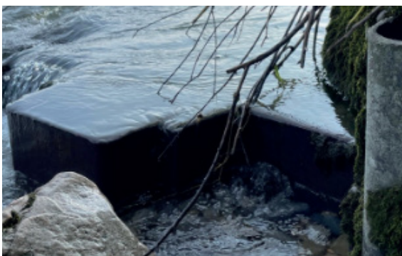
Die Spundwand am Uferrand

In der bestehenden Schwelle ist eine Spundwand (Stahlwand) verbaut. Diese wurde lokal um bis zu 1m abgesenkt, um die zu überwindende Sprunghöhe für die Fische zu reduzieren. Vielleicht waren Ihnen die Blocksteine aufgefallen, welche den Wanderweg blockiert hatten. Mit diesen wurden zusätzlich oberhalb der Schwelle ein Halbkreis geformt.