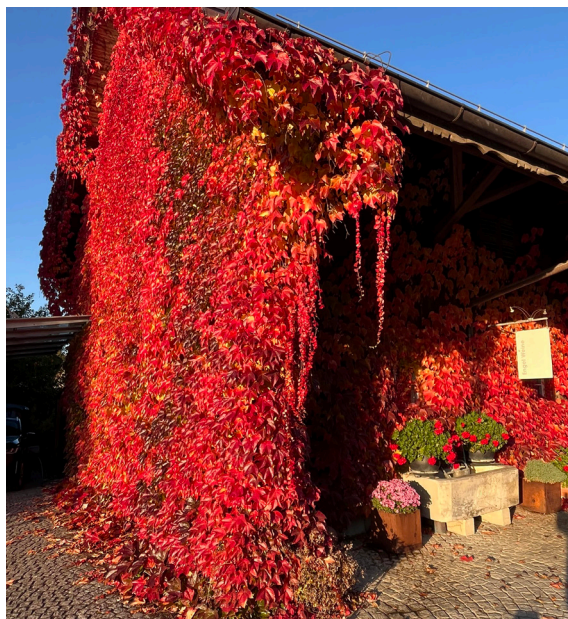
Herbstliche Farbenpracht