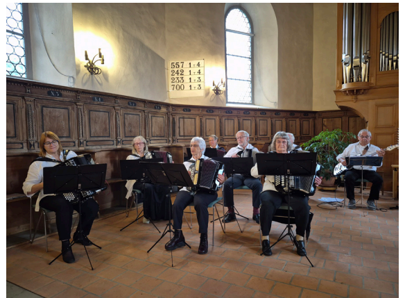
Die Oldies Handorgelfründe spielten zum letzten Mal in unserer Kirche – herzlichen Dank für eure schöne Musik!

Vielen Dank an Alle, die etwas zu diesem speziellen Gottesdienst beigetragen haben.